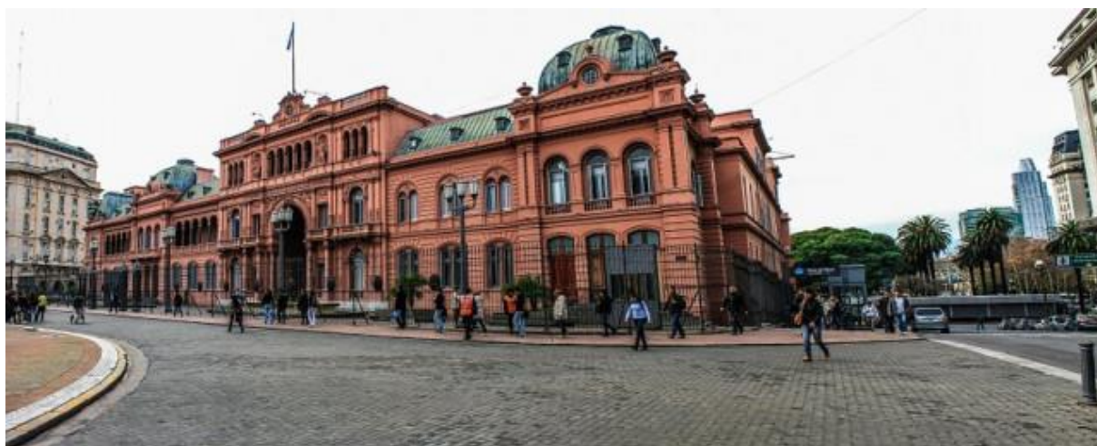
Casa Rosada